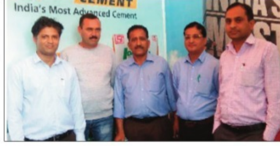
मेले में पहुंचे ड्यूरॉटन सीमेंट कंपनी के अधिकारी लोगों को कंपनी के सीमेंट की खूबियां बताते हुए तथा (दाएं) मेले में कंपनी के स्टॉल पर उमड़ी लोगों की भीड़।

जालंधर, 22 मार्च (सतीश शर्मा) : हिमाचल प्रदेश के सुप्रसिद्ध मेलों में शुमार बिलासपुर के राज्य स्तरीय नलवाड़ी मेले में ड्यूरॉटन सीमेंट की खासी धूम रही। इस राज्य स्तरीय नलवाड़ी मेले की 16 मार्च से शुरुआत हुई थी जो 23 मार्च तक जारी रहेगा।