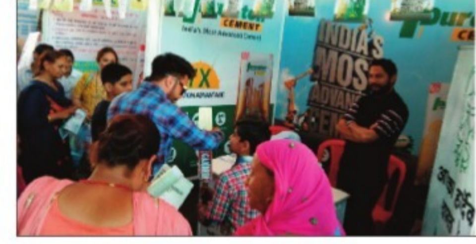
अनुसार इस मौके पर बिलासपुर के विधायक सुभाष ठाकुर ने विशेष तौर पर पहुंचकर कंपनी के स्टॉल का शुभारंभ किया था। अधिकारियों ने न केवल विधायक सुभाष ठाकुर को, बल्कि मेले में पहुंचे लोगों को कंपनी के इतिहास से अवगत करवाया तथा उन्हें कंपनी की ओर से अत्याधुनिक और विश्वस्तरीय रोबोटिक प्लांट

कंपनी के अधिकारियों ने मेले में पहुंचे लोगों को ड्यूरॉटन सीमेंट की बताई खूबियां